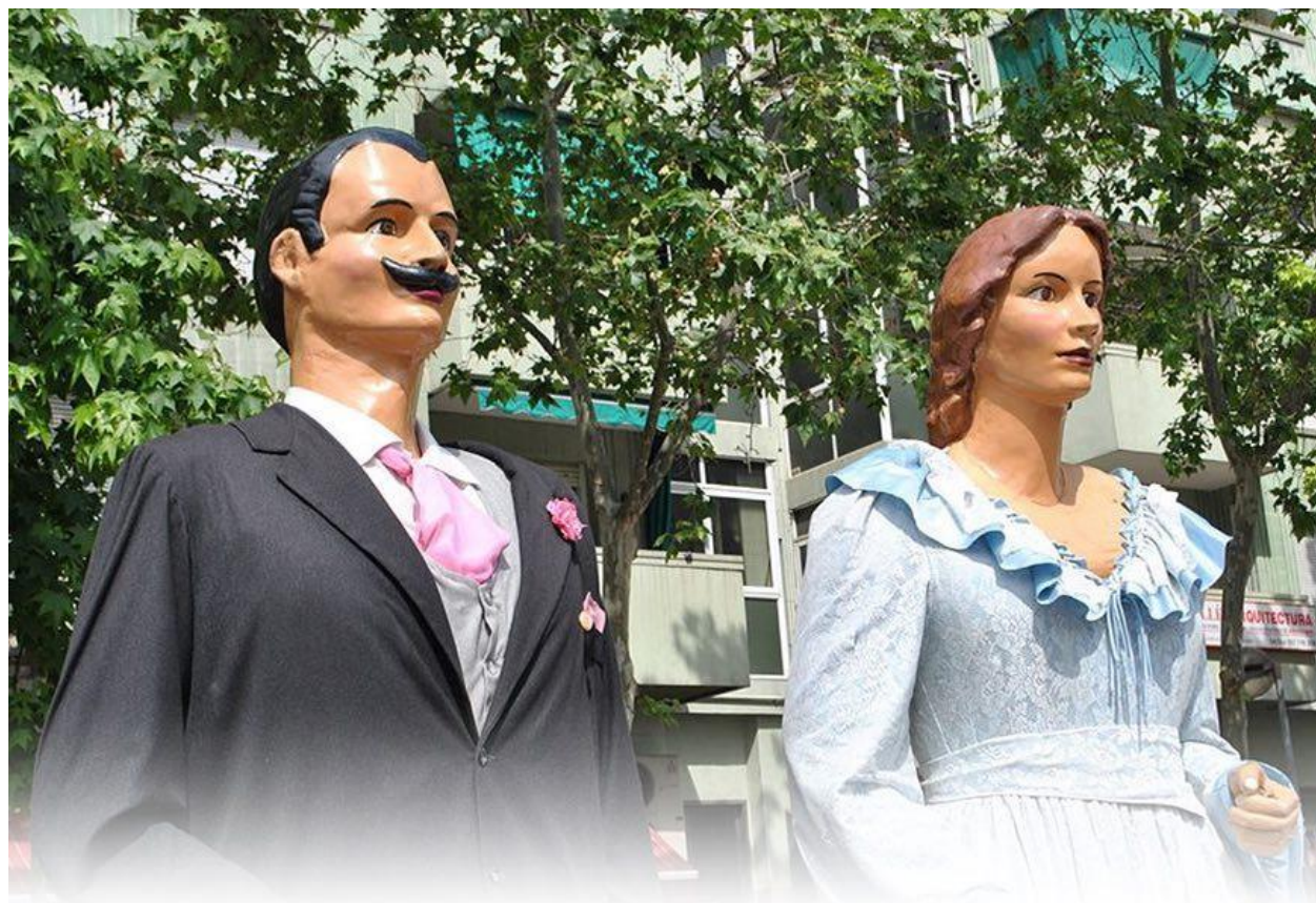
GEGANTS DE LA CREU ALTA (SABADELL)