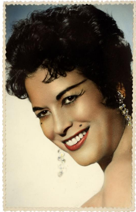
100 anys del naixement de la 'Maty Mont'