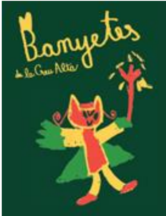
10è aniversari dels Banyetes de la Creu Alta